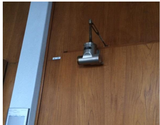
Bild 2. Oljefylld dörrstängare