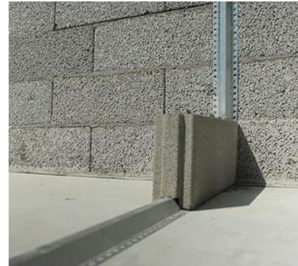
Bild 1: Leca Innerväggsblock monterat på startprofil av stål som fästs mot såväl golv som vägg.

Montage av ovanstående väggtyp kan göras i obrutna väggpartier upp till 10 m beroende på vägghöjd, förväntade laster, förankringspunkter och vald blockbredd.