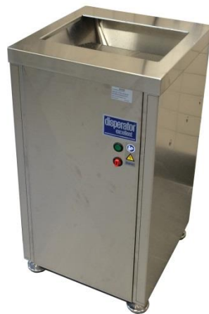
Inkastbänk till avfallskvarn.

Avfallskvarn direkt i avloppet är inte tillåtet för skolor och de förskolor som SISAB förvaltar.