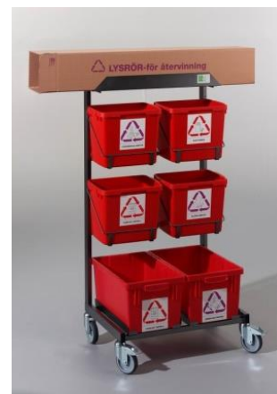
Sorteringsvagn med batteriholk m.m.

Om du har synpunkter, skriv ett mail till godaexempel@sisab.se .