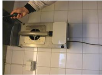
Joniseringsaggregat på Ålstensskolan. Bilden till höger visar joniseringsröret med bakomliggande fläkt.