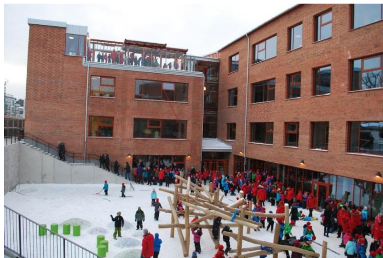
Lugnets Skola invigdes januari 2014 och blev verifierad med betyget Guld i april 2017

I samband med projektets garantibesiktning ska den slutliga certifieringen vara klar, d.v.s. verifieringen vara inskickad och godkänd. Då samlas alla handlingar som ligger till grund för certifikatet i den berörda fastighetens miljöbyggnadsmapp i SISAB:s fastighetssystem FasIT. Projektledaren ansvarar, med hjälp av miljöbyggsamordnaren, för att handlingarna skickas till den funktion på fastighetsavdelningen som sköter inläggning i FasIT.