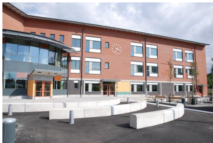
Mariehällsskolan invigdes augusti 2014 och är preliminärt certifierad med betyget Silver.

Certifieringen är giltig i maximalt 10 år eller tills byggnaden genomgått större förändringar i verksamheten eller har byggts om. Om det inom 10 år sker förändringar - som exempelvis verksamhetsanpassningar eller byte av trasiga fönster - bör det om möjligt säkerställas att Miljöbyggnads krav fortfarande uppnås.