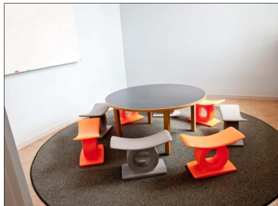
Grupp i Globala gymnasiet