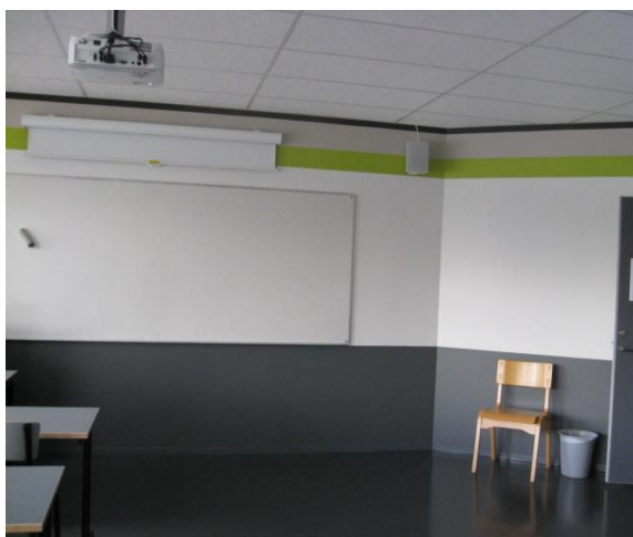
Klassrum i Franska skolan på Essinge