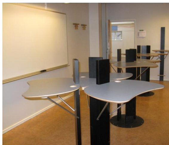
Ärvingeskolan – "Framtidens klassrum"