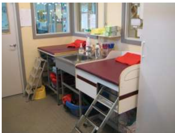
Dubbel Skötbordsuppställning enligt ritning A7, Barnet 1, Östbergabackarna 50