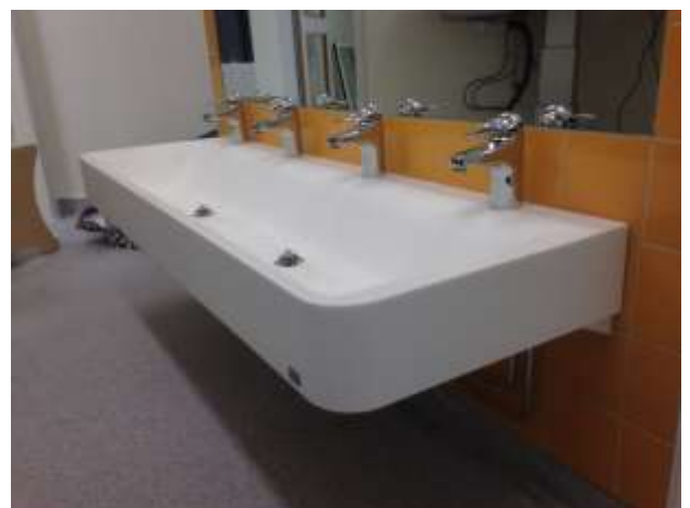
Tvätträna i porfritt material, corian, med rundade hörn, spegel och kakel enligt ritning A7, Vasan, Vasaloppsvägen 112