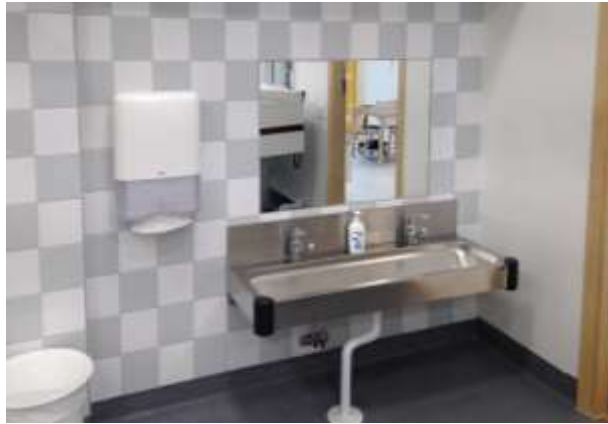
Tvättträna och spegel enligt ritning A7, Blomsterkungen, Blomsterkungsvägen 235