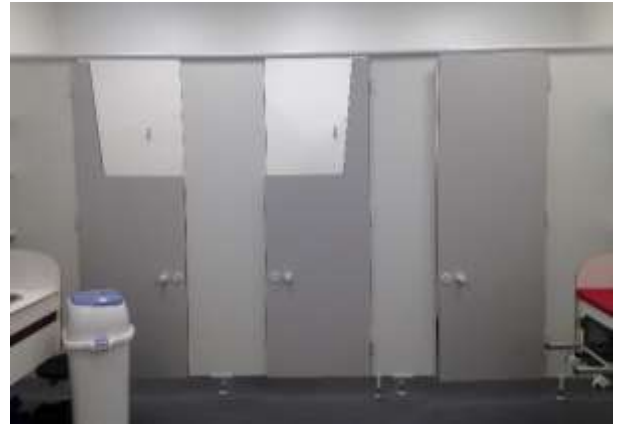
Skärmvägg/dörrar till barn-wc, enligt ritning A7, Blomsterkungen, Blomsterkungsvägen 235