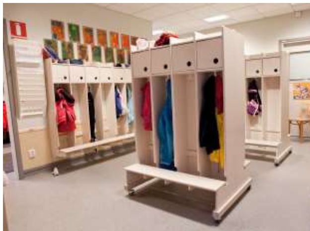
Kapphyllfack i kapprum, mobila och fasta enheter Barnet, Östbergabackarna 50

Skärmväggar till wc utförs med urskurna dörrar för barnens integritet och personalens överblick.