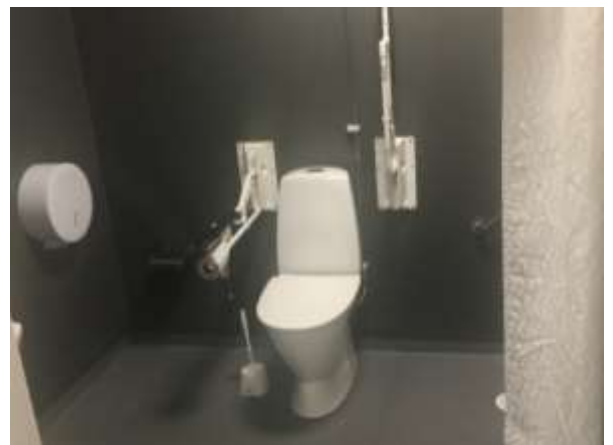
RWC med plastgolv och -väggar istället för kakel Förskolan Bergsgården, Bredbyplan 34