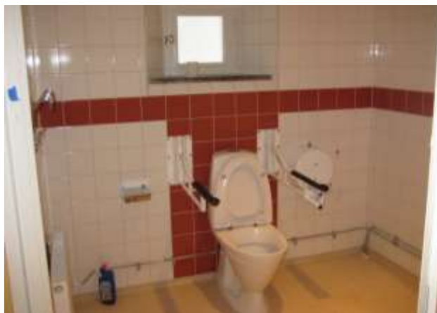
RWC enligt ritning A7