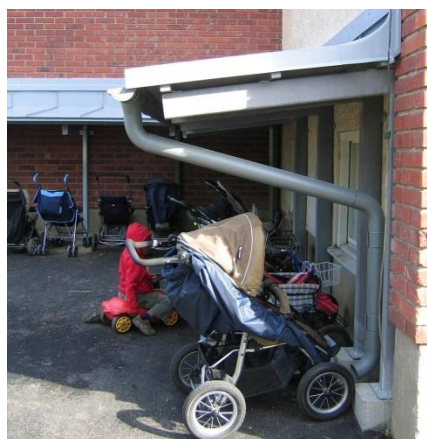
Barnvagnstak av obrännbart material, Magelungsskolan, förskola