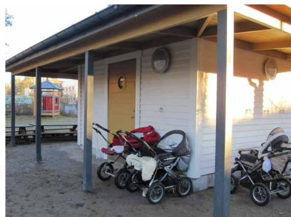
Barnvagnstak i anslutning till förråd, Tumultgränd 69