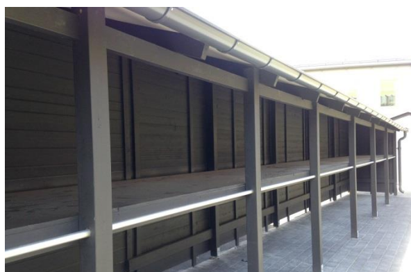
Barnvagnstak i två våningar, Emågatan 10