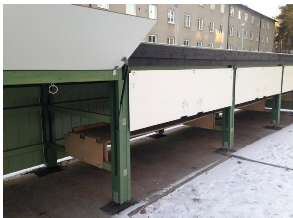
Barnvagnstak med öppningsbart väderskydd, Vasaloppsvägen 110-112