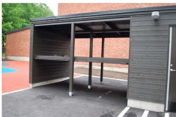
Tvåsidigt barnvagnstak i två våningar, Zornvägen 26