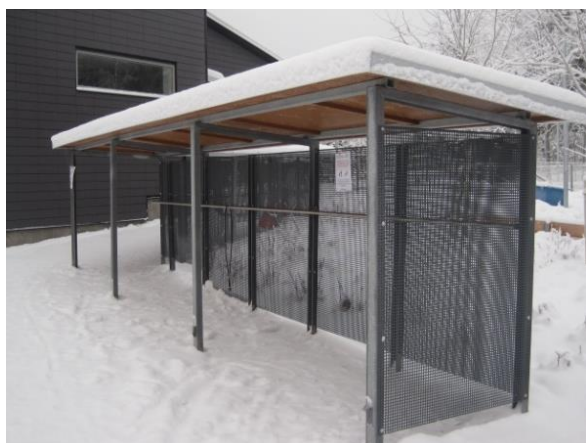
Barnvagnstak av obrännbart material, Trollesundsvägen 55