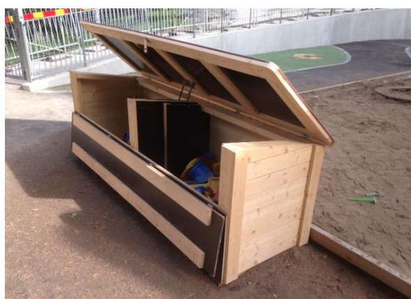
Leklåda, Erik Segersällsväg 24