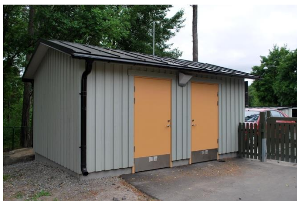
Förråd med plåttak, Östbergabackarna 50

Leklådor ska vara utformade så att barnen själva kan hämta och lämna leksakerna som är i lådorna. Ett sätt är att välja förvaringslådor med halva fronten nedvikbar. Lådan ska vara säkert utformad så att barnen inte kan klämma sig eller få locket över sig. För att undvika detta ska locket vara försett med gasdämpare. Locket ska alltid vara låsbart, lämpligen med ett hänglås. Undvik att placera leklådor vid staket, då de kan användas för att klättra över staketet.