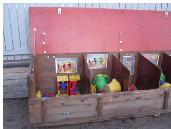
Leklåda med fack, Skogsnävegränd 16