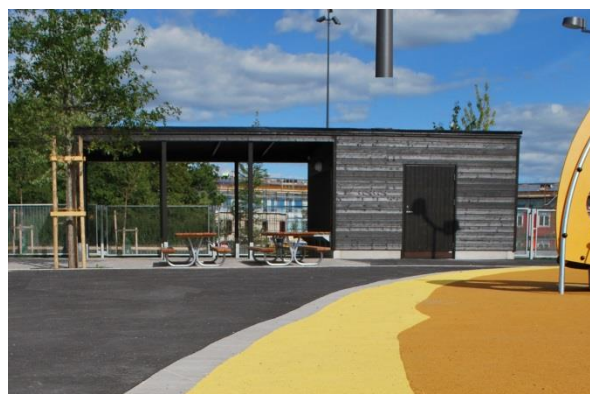
Förråd med väderskydd, Pippi Långstrumps gata 12