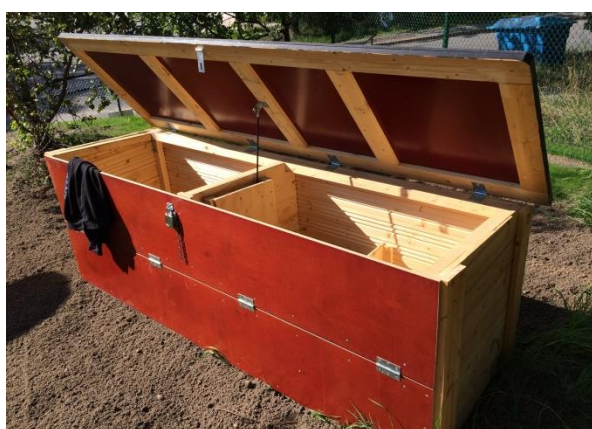
Leklåda, Kransbindarvägen 120