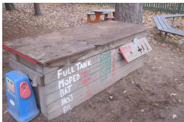
Leklåda som mack, dubbelfunktion, Ryttmästarvägen 140