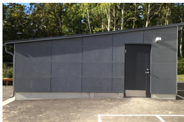
Förråd med samma fasadmaterial som huvudbyggnad, Lingonrisgränd 4