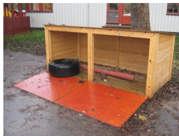
Cykelförråd, Gliavägen 128-130