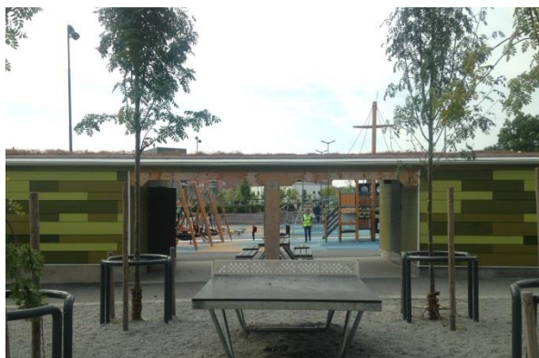
Förråd med väderskydd ovanför ingång Mariehällsskolan