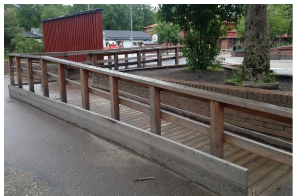
Springvänlig ramp, Sköndalsskolan