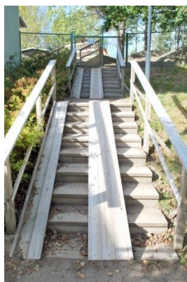
Marktrappa Nockeby kyrkväg 8