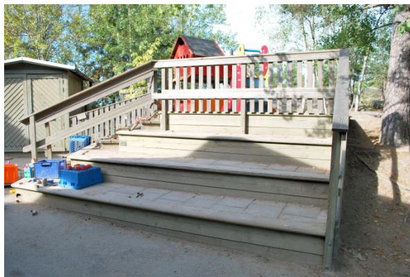
Trappa och gradäng, Nockeby Kyrkväg 8

Verandor och terrasser kan användas för utevila och/eller till mötesplatser av olika slag. Är verandan/terrassen i närheten av huset kan den också användas som uteateljé eller plats för matbord så att barnen kan äta ute.