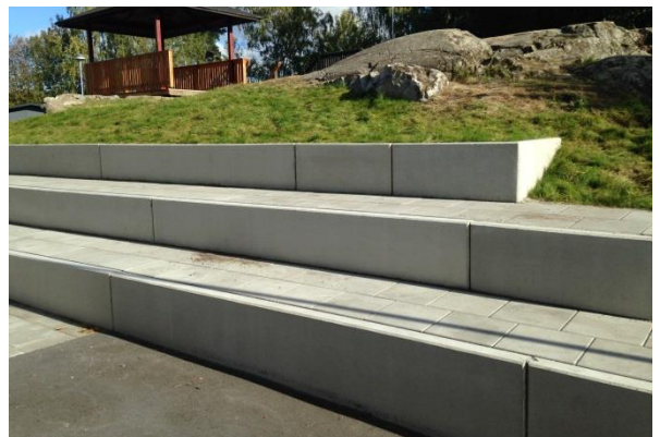
Gradäng anpassad till terrängen, Lingonrisgränd 4