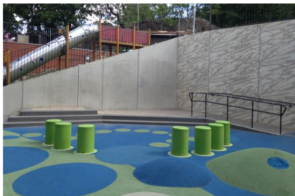
Scen, ramp och podie samordnat med hopp-pelare som även kan nyttjas som sittplats, Lugnets skola