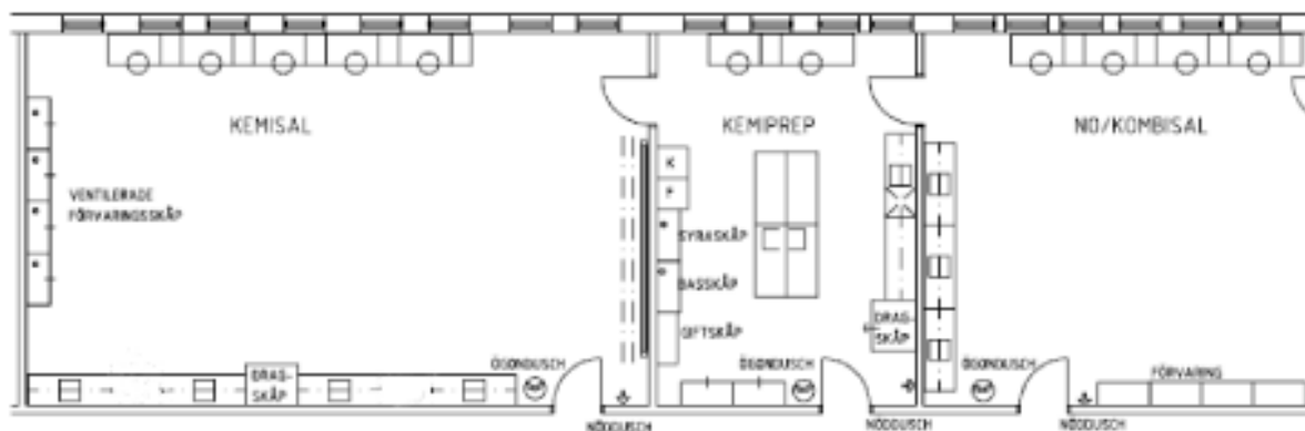
EXEMPEL PÅ NO-LOKALER