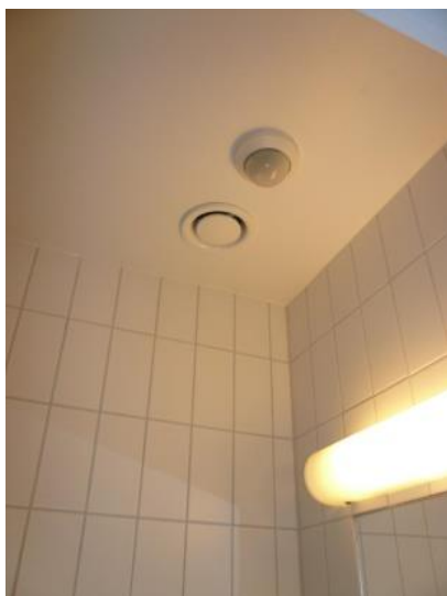
Exempelbild 11. Extern närvarogivare för styrning av belysning och avstängning av vatten.

Funktionen skall i de fall den finns bibehållas.