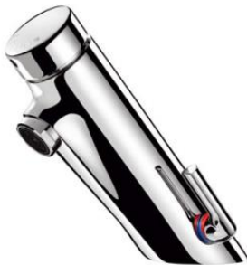
Exempelbild 9. Blandare Heno typ Temposoft. Vid högt vattentryck skall blandare strypas för att undvika vattenstänk. Kontakta HENO.

Vid reparationer och mindre ombyggnader som ej har central motoriserad avstängning på vattenrörsstråk ska mekaniska impulsblandare med anti-blockfunktion väljas exempelvis Heno Temposoft. Impulsblandare.