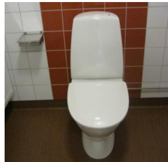
Exempelbild 4. Sanitetspåshållare och kontrastmarkering bakom toalettstolen

Stäm av fabrikat för beslag för toalettpapper, tvål, pappershanddukar etc med Utbildningsförvaltningen så att dessa är anpassade till de avtal som staden har för inköp av förbruksvaror. Lösa toalettborstar köps in separat av staden. För information om avtal kontakta lokalvårdsstrateg på Utbildningsförvaltningen.