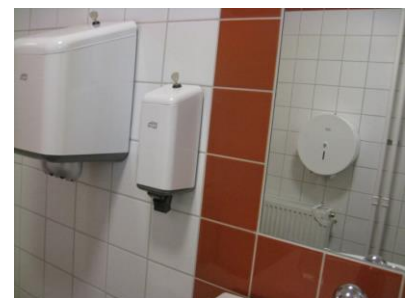
Exempelbild 1. Infälld spegel

Om du har synpunkter, skriv ett mail till godaexempel@sisab.se .