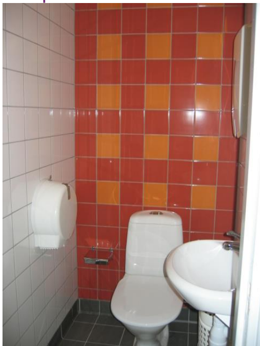
Exempelbild 12. Kontrastmarkering bakom toalettstol.