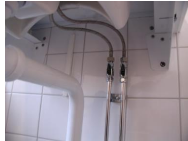
Exempelbild 10. Installation under tvättställ