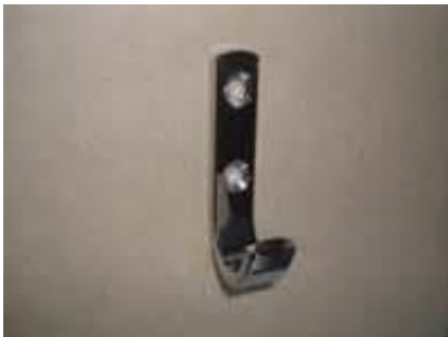
Exempelbild 3. Hängare typ "halv" skolkrok

Typ "halv" skolkrok, Byggbeslag eller likvärdig monteras på vägg, inte på dörr.