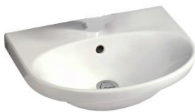
Exempelbild 8. Tvättställ Gustavsberg typ Nautic 5550. Mått 500x380 mm.

Tvättställ monteras på förstärkta konsoler och skall ha bottensil och vara försedd med bräddavlopp.