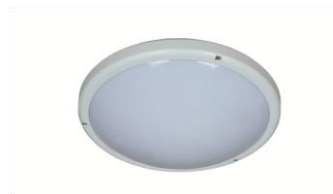
Exempelbild 6. Cardi Omega L240223031 vit 22W Led 3000K med inbyggd mikrovågssensor