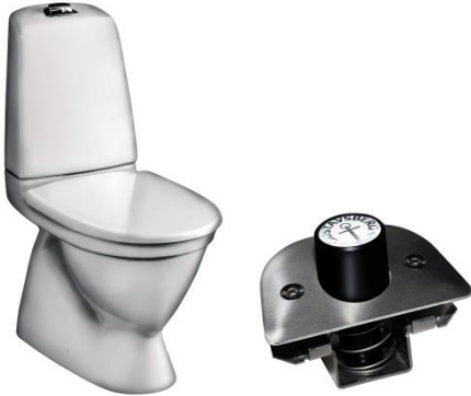
Exempelbild 7. För offentlig miljö använd WC med dolt S-lås och vandalsäker enkelspolning och hård sits.

Vid renovering av enstaka toaletter i en skola anpassas utrustningen till den övriga utrustningen på skolans toaletter. Kontrollera avloppets avsättning från vägg innan beställning. Det bör finnas ca 5 cm fritt utrymme från wc-stolens bakkant till vägg för städning. Toalettstolen skall tätas mot golv med fog avsedd för våtrum. Toalettlock och ring ska vara enkla att lyfta på för att underlätta rengöring.