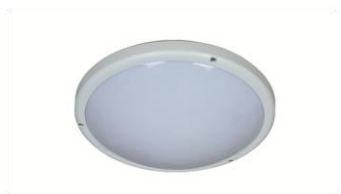
Exempelbild 5. Cardi Omega L240223011 vit 22W Led 3000K

Välj armatur som är slagtålig och där verktyg krävs för byte av ljuskälla centrerad över spegeln. Löstagbara lampkupor undviks då de kan fyllas med div material.