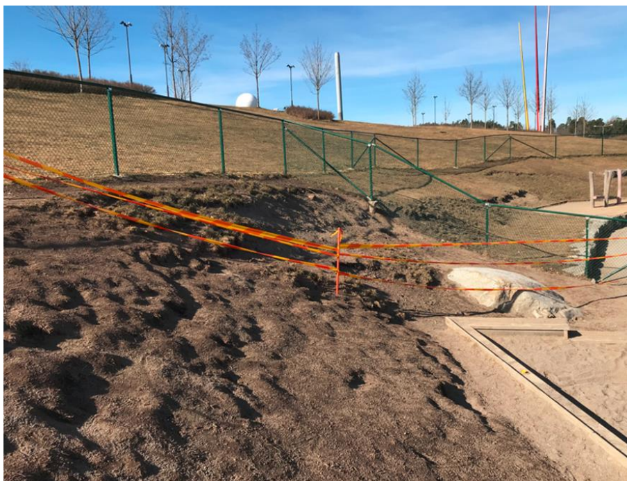
Dartanjangs gata, Mariehäll

Kullar och slänter har en tendens att slitas hårt. Vid alltför hög användning eroderar till slut översta lagren bort och blottar den bara jorden/fyllnadsmassorna. Verksamheten kan inte längre nyttja ytan såsom den var tänkt att användas.