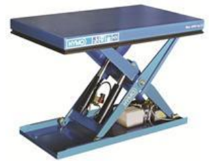
Exempel lyftbord, överväg ramp i första hand

Beakta kraven i för lyftbord i AFS 2008:3 och BFS 2011:12 med ändringar tom H16.