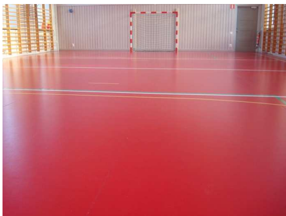
Bild 3: Högalidskola, Punktlastiskt sportgolv med Taraflex Performance 9,0mm sportmatta installerat mot betong