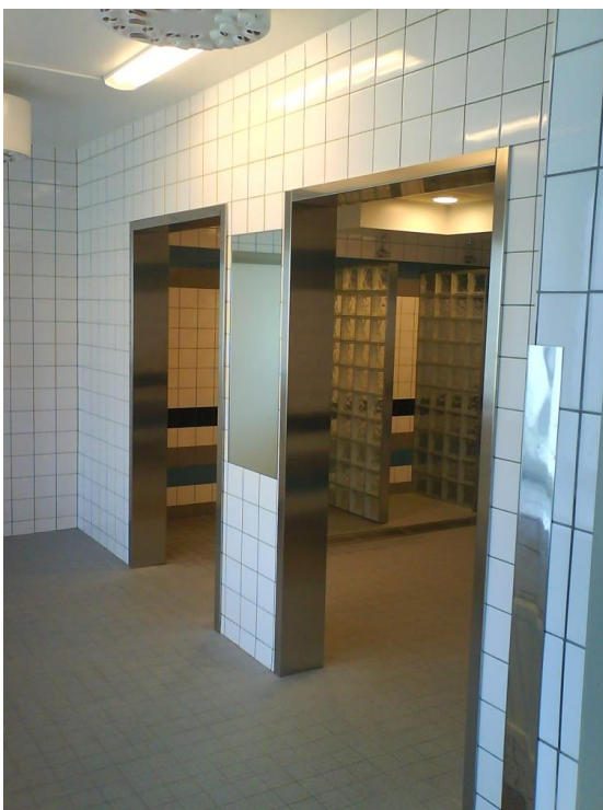
Duschrum på Äppelviken skola med spegel infälld i kaklet