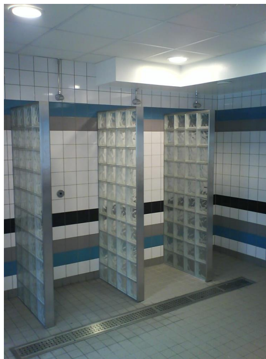
Duschrum på Äppelviken skola med skärmvägg av glasbetong