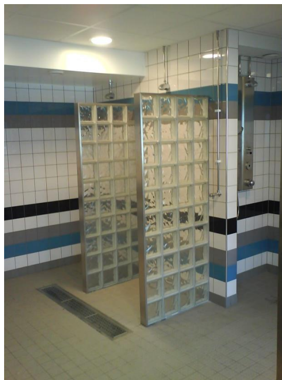
Lokalt fall mot brunn