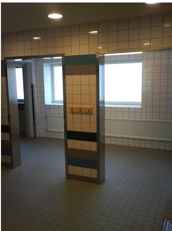
Hörnskydd i rostfritt